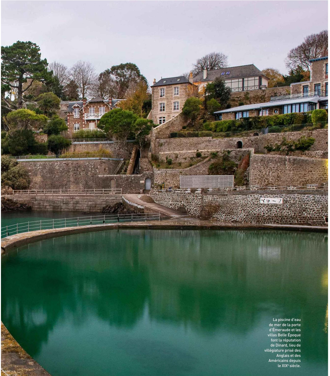
La piscine d'eau de mer de la porte d'Émeraude et les villas Belle Époque font la réputation de Dinard, lieu de villégiature prisé des Anglais et des Américains depuis le XIX e siècle.